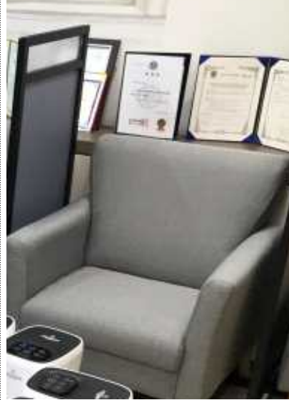
(출입구) 체온 측정, 방명록 작성, 안내문 비치